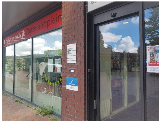
Voor een toelichting op de foto's in dit rapport, zie pagina 18

De laagdrempelige activiteiten in buurthuizen zouden bovendien een plek kunnen zijn om LVB vroegtijdig te signaleren en van waaruit bewoners toegeleid kunnen naar zwaardere vormen van ondersteuning en zorg (Movisie, 2018). Dat moet ertoe bijdragen dat het verdere verloop van eventuele hulpverlening beter ingericht kan worden en meer kans van slagen heeft (persoonlijke communicatie, beleidsmedewerker Gemeente Amsterdam, 12-12-2022).